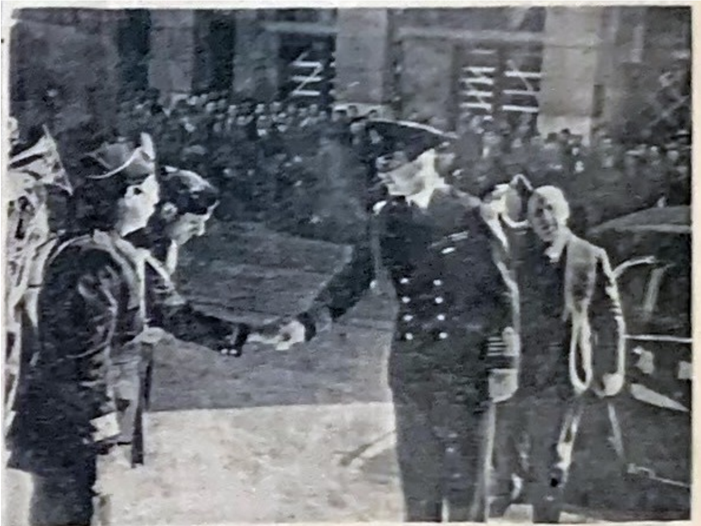
Ἡ Α. Β. Υ. ὁ Διάδοχος προσερχόμενος εἰς τὸ «Παλλάς» κατὰ τὴν χθεσινὴν συγκέντρωσιν τῶν βαθμοφόρων καὶ στελεχῶν τῆς Ἐθνικῆς Ὄργανώσεως Νεολαίας.

Στην Καθημερινή της 8 ης Μαρτίου 1941 ο Γεώργιος Βλάχος απευθύνεται στο κύριον άρθρον εις τον Χίτλερ. Στην ίδια πρώτη σελίδα είναι η φωτογραφία του Διαδόχου Παύλου κατά την άφισιν του εις την συγκέντρωσιν της Ε. Ο.Ν, εις την αίθουσαν του κινηματογράφου «Παλλάς», όπου η Εθνική Οργάνωσις της Νεολαίας υπεδέχθη χθες την Α.Β.Υ. τον Διάδοχο Παύλο επανελθόντα από περιοδείαν ανά το μέτωπον.